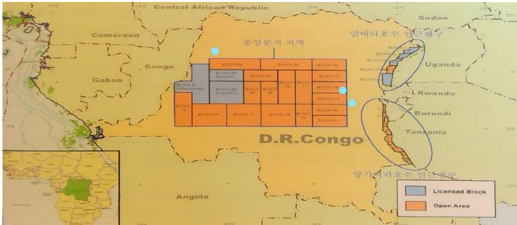
〈 콩고 민주공화국 석유광구 현황 〉

콩고 민주공화국의 석유 산업은 1960대에 태동하였으나, 1970년부터 본격화되었다. 석유·가스의 개발이 이루어지고 있는 지역은 콩고 민주공화국 남부 해상 및 인근 육상지역이다. 한편, 서부 및 중앙분지 지역은 내전이 종료된 이후 탐사권이 부여되어 탐사작업이 진행되고 있다. 19) 콩고 민주공화국의 주요 석유광구는 아래 그림과 같다.